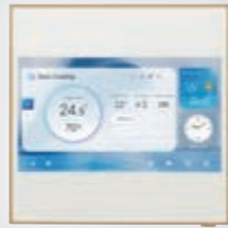
A09GA2 / A12GA2