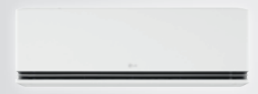
H09S1PA / H12S1PA