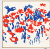
A09GA1 / A12GA1