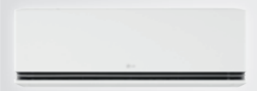
H18S1DA / H24S1DA