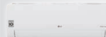
S18EC / S24EC