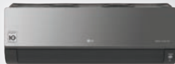
AC18BK / AC24BK